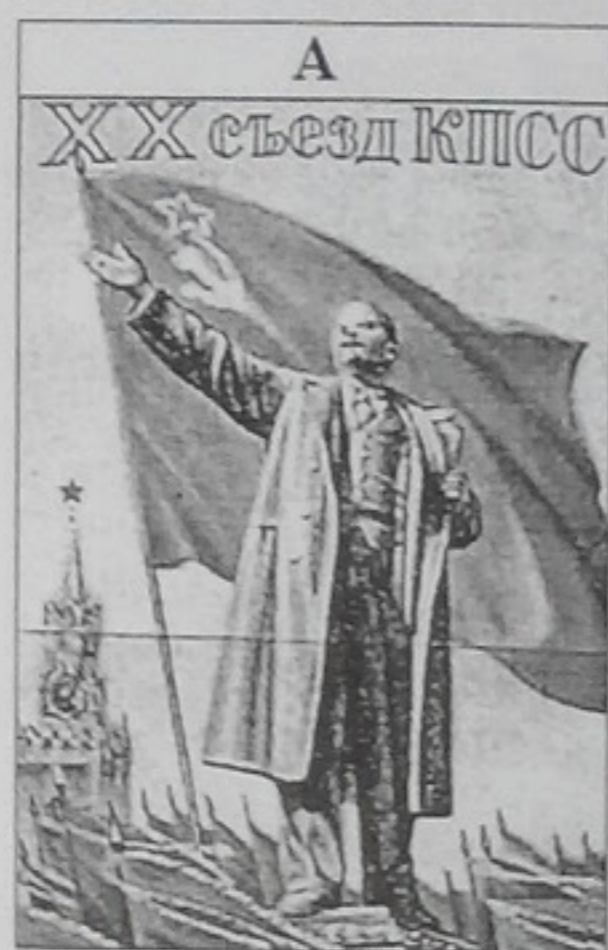
XX з'їзд КПРС

52. Установіть послідовність епох, відображених на радянських пропагандистських плакатах.