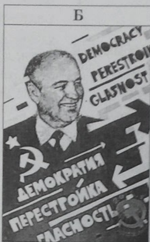
Демократія. Перебудова. Гласність.