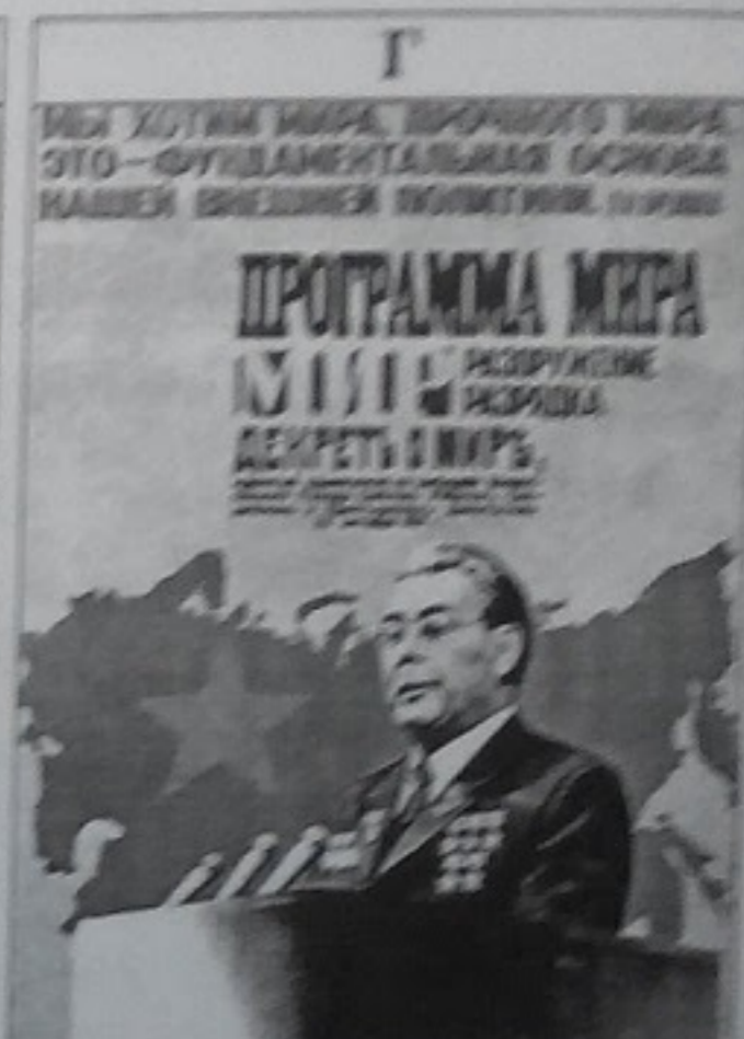
Ми хочемо миру, міцного миру. Це - фундаментальна основа нашої зовнішньої політики.