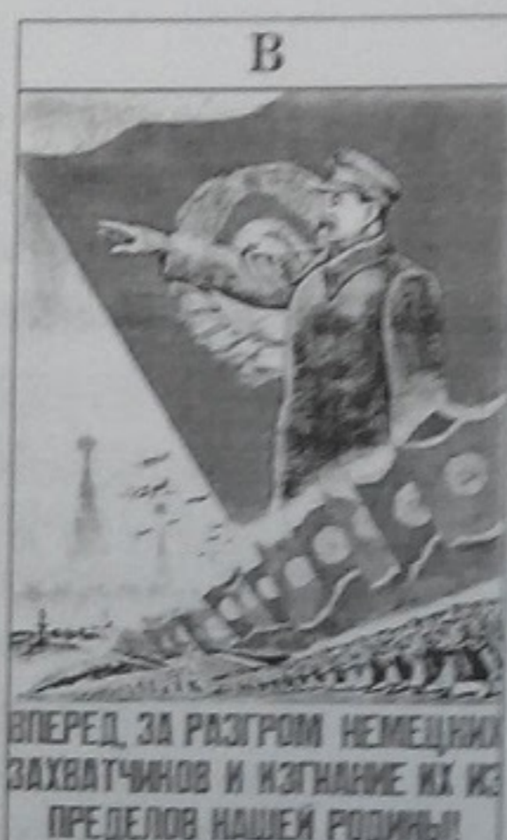
Уперед, за розгром німецьких загарбників і вигнання їх за межі нашої Батьківщини!