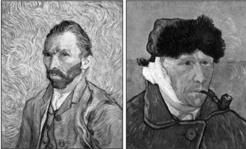
Вінсента Ван Гога.

24. На репродукціях зображено автопортрети