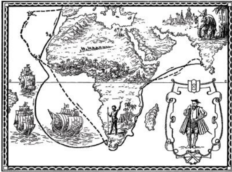
Васко да Гама.

11. На зображеній гравюрі позначено маршрут експедиції